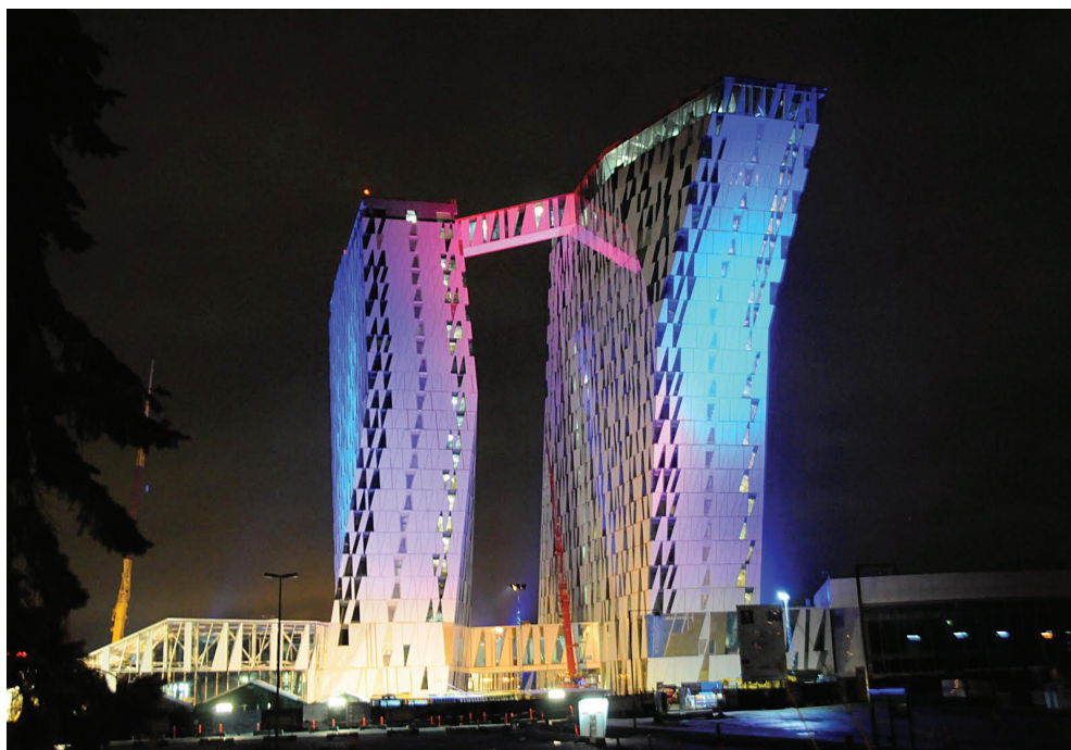
Hotel Bella Sky – »sanatorij« za dizajnerske manijake v Kopenhagnu. Je samozadosten – sami proizvajajo elektriko, odvečno prodajajo naprej.

Na to vprašanje vam bom poskusil odgovoriti v svojih člankih, predvsem pa je moja želja prebuditi v vas skriti košček za estetiko, ali če je ta že razvit, ga razširiti in nadgraditi. Estetika in dizajn se dopolnjujeta na vsakem koraku in velika škoda je, da tega dela sebe ne bi poznali in razvijali, saj je dizajn hrana za dušo.